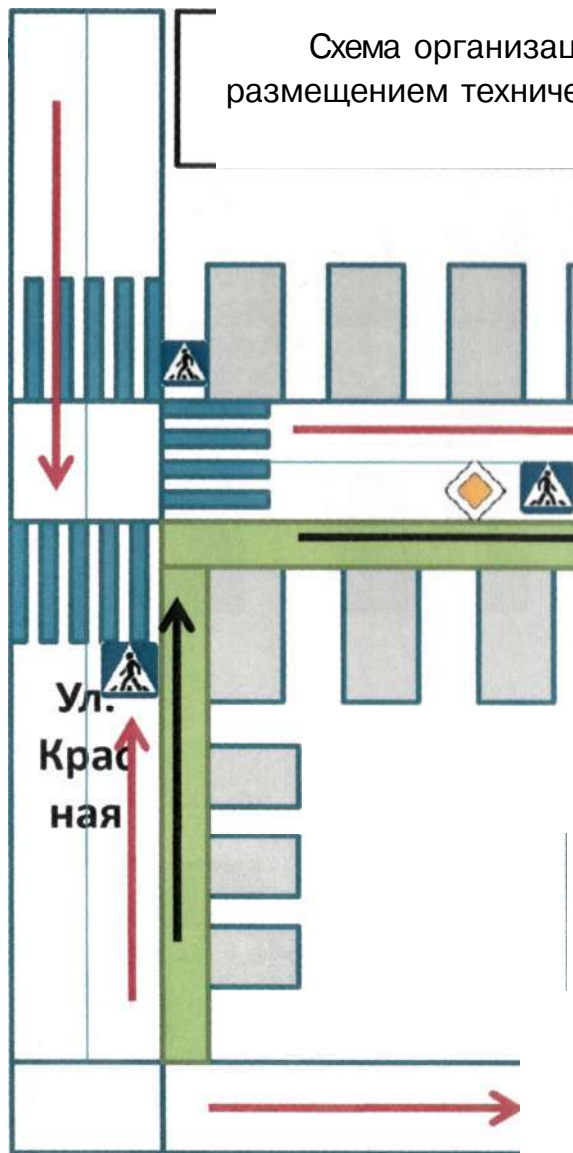
Схема организации дорожного движения в непосредственной близости от МБДОУ с размещением технических средств, маршруты движения детей и расположение парковочных мест