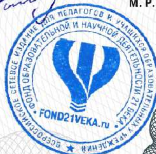
М. Р. Гильмиев

ДАТА ПРОВЕДЕНИЯ КОНКУРСА: с 10.01.2023 по 30.04.2023