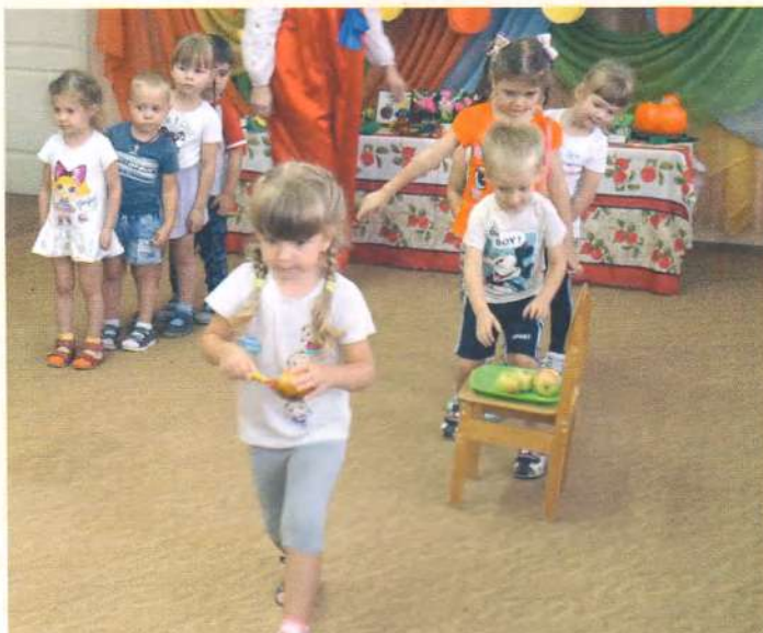
Игра «Варим яблочный компот»