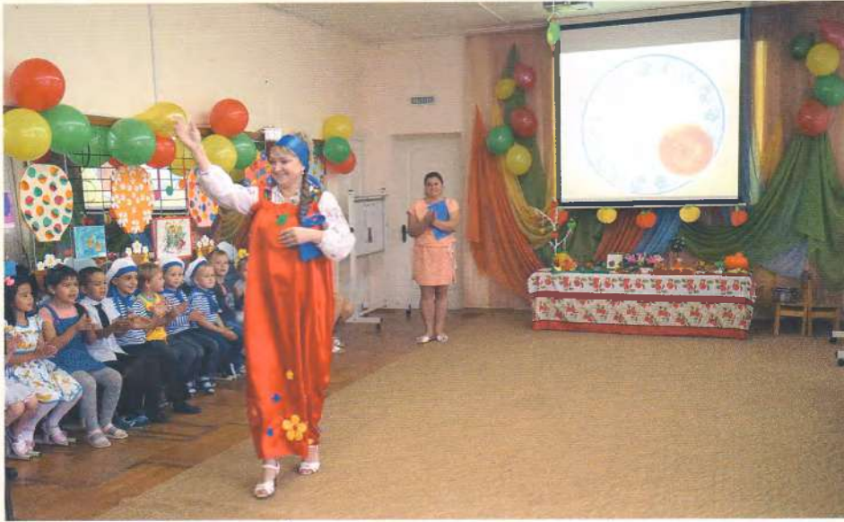
Яблочко наливное, яблочко золотое...