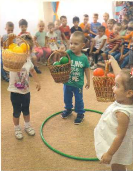
Игра «Соберём урожай»