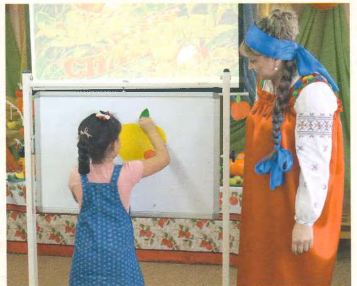
Игра «Сложи яблоко»