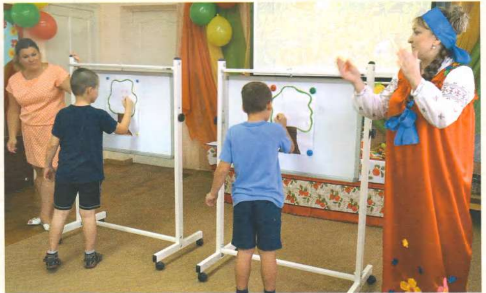
Игра «Юные художники»